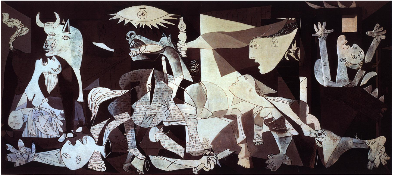
Pablo Picasso, Guernica , 1937. ਪਾਬਲੋ ਪਿਕਾਸੋ, ਗੁਆਰਨੀਕਾ, 1937

When this painting was made, most people would have been aware that the small Spanish village of Guernica was bombed by Italian and German warplanes. The Pro-Fascist Spanish government believed the village contained anti-Fascist rebels, and asked Italy and Germany to help fight.