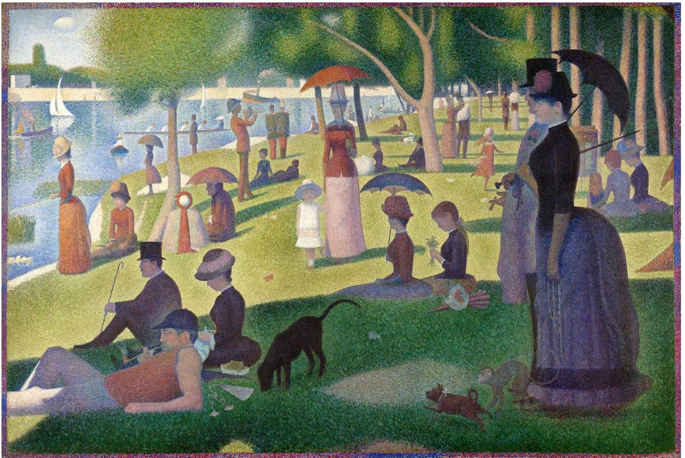
Georges-Pierre Seurat, A Sunday Afternoon on the Island of La Grande Jatte , 1884–1886 ਜੋਰਜਸ-ਪੀਅਰੇ ਸਿਊਰਾਟ, ਲਾ ਗ੍ਰਾਂਡੇ ਜੱਟ ਦੇ ਟਾਪੂ 'ਤੇ ਐਤਵਾਰ ਦੀ ਦੁਪਹਿਰ, 1884-1886

You are allowed to use phone or computer-based translation for this assignment. If you do, please send the results to: ddrapak@gnspes.ca .